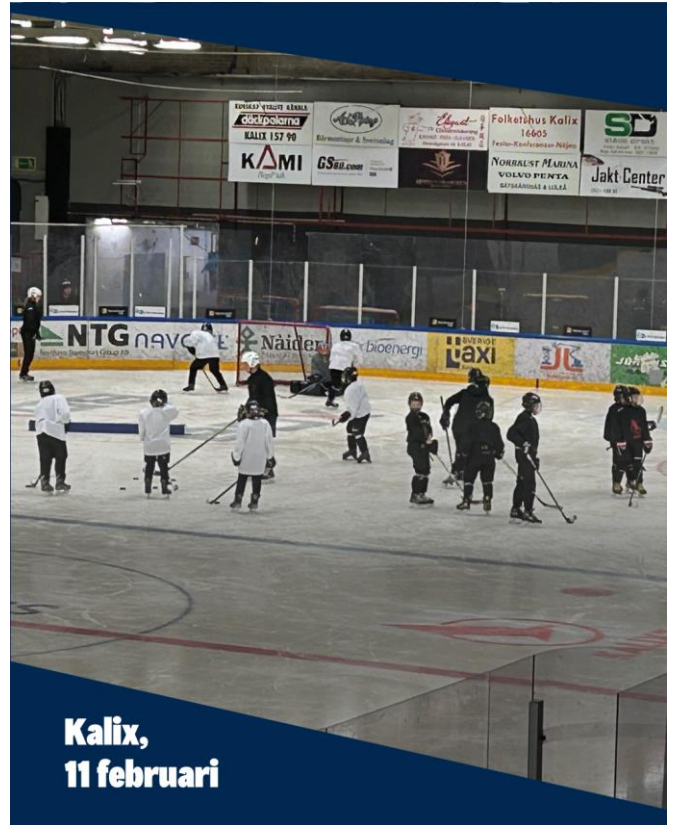
Kalix, 11 februari