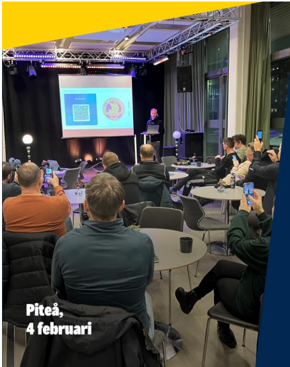
Piteå, 4 februari