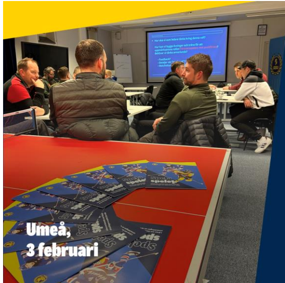
Umeå, 3 februari