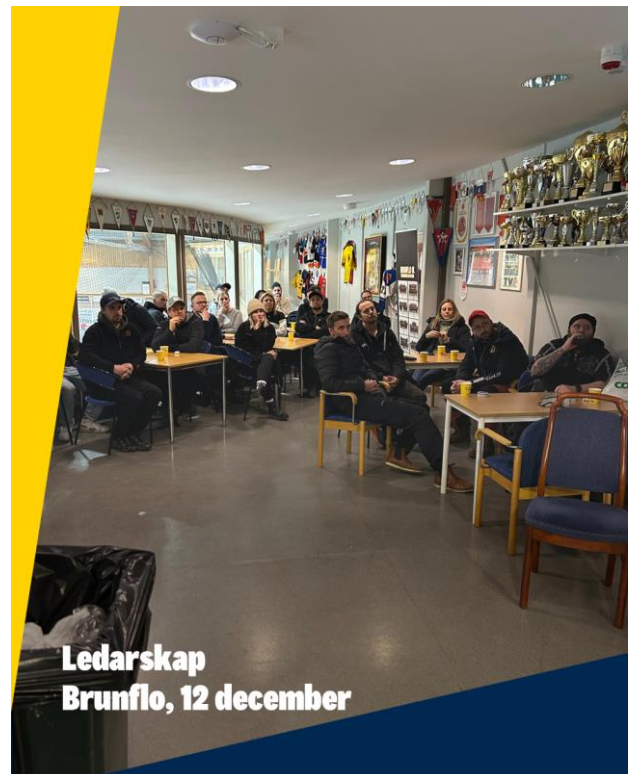
Ledarskap Brunflo, 12 december