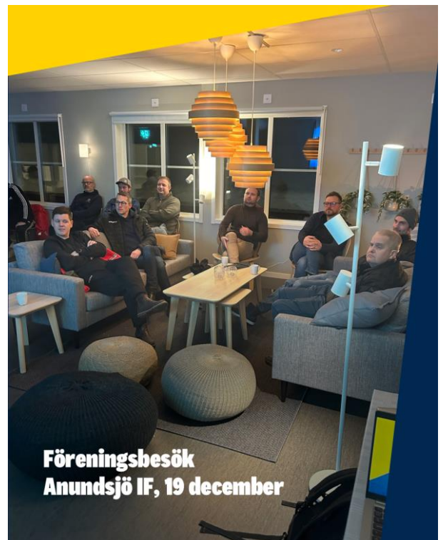
Föreningsbesök Anundsjö IF, 19 december