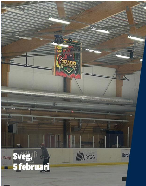
Sveg, 5 februari