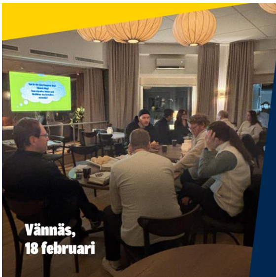
Vännäs, 18 februari