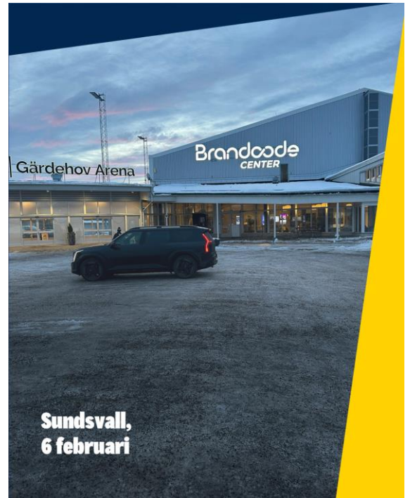
Sundsvall, 6 februari