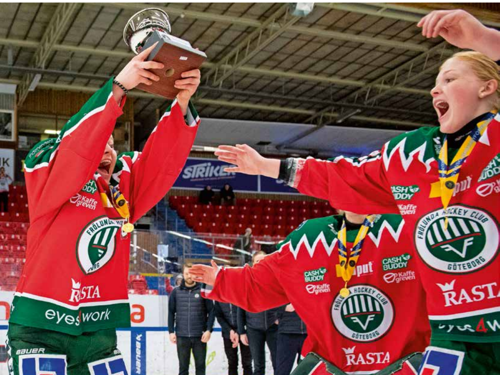
Frölunda vann damjuniorslutspelet.