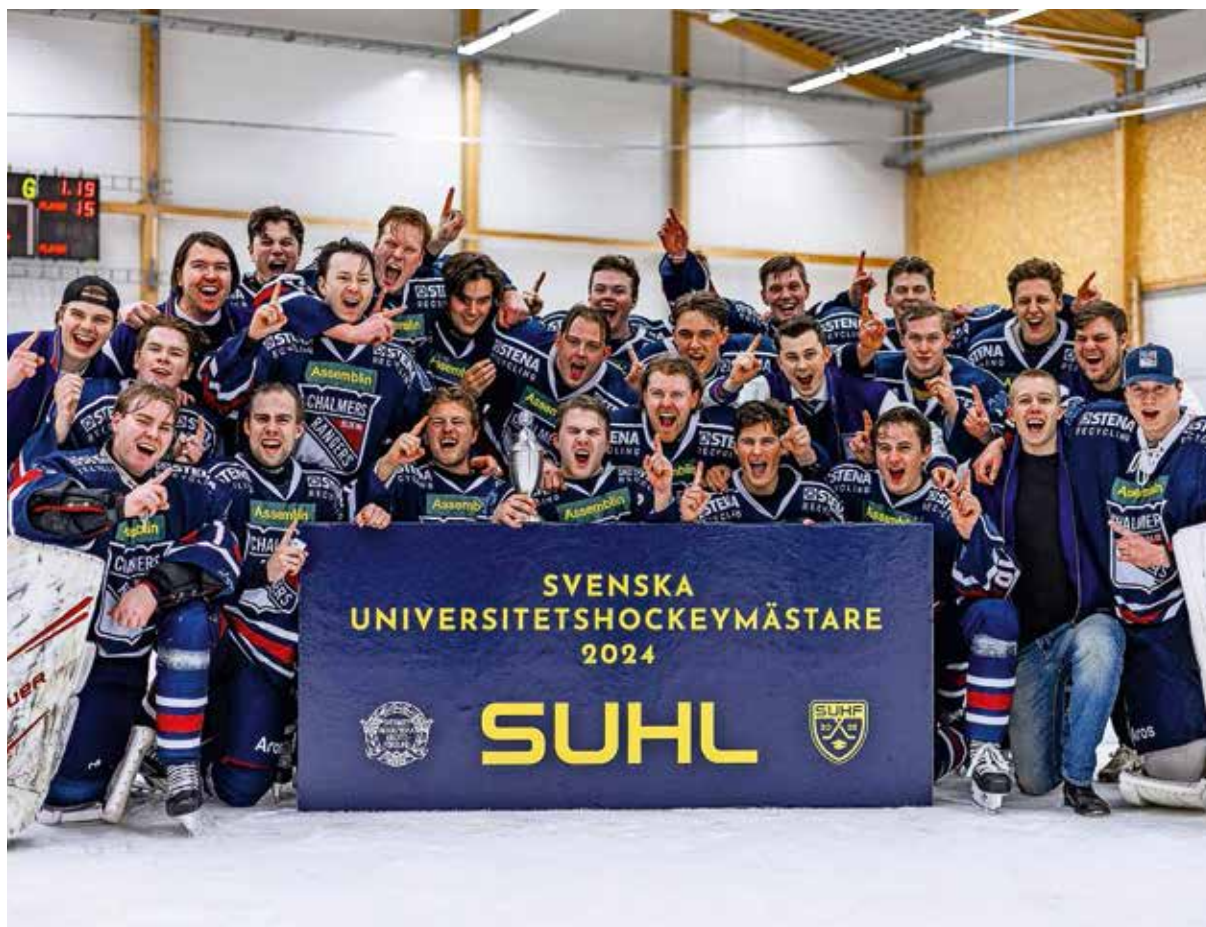
Chalmers Blue McRangers blev svenska universitetshockeymästare 2024

LTH Griparna - Chalmers Blue McRangers 2-3 (0-0, 2-1, 0-1, 0-0, 0-1) 212