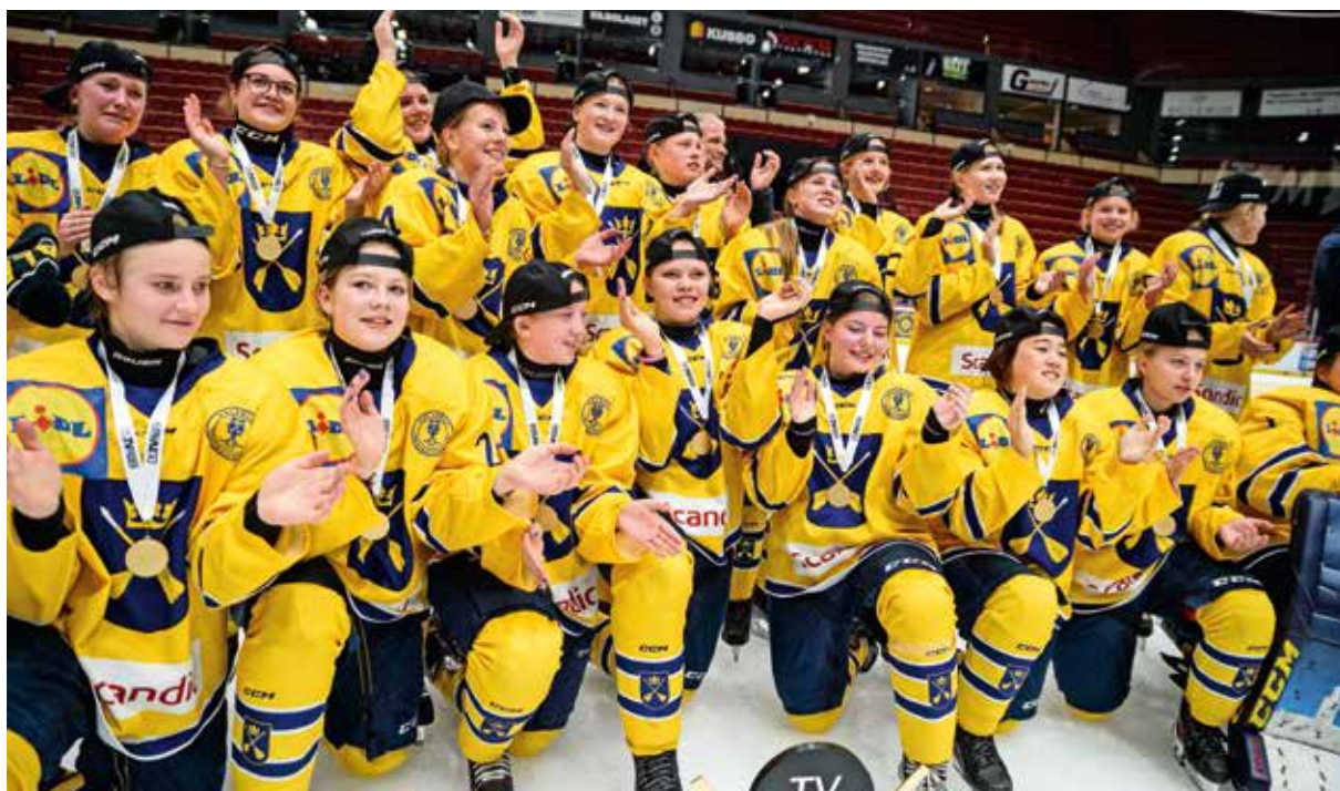
Dalarna vann TV-pucken för flickor 2023