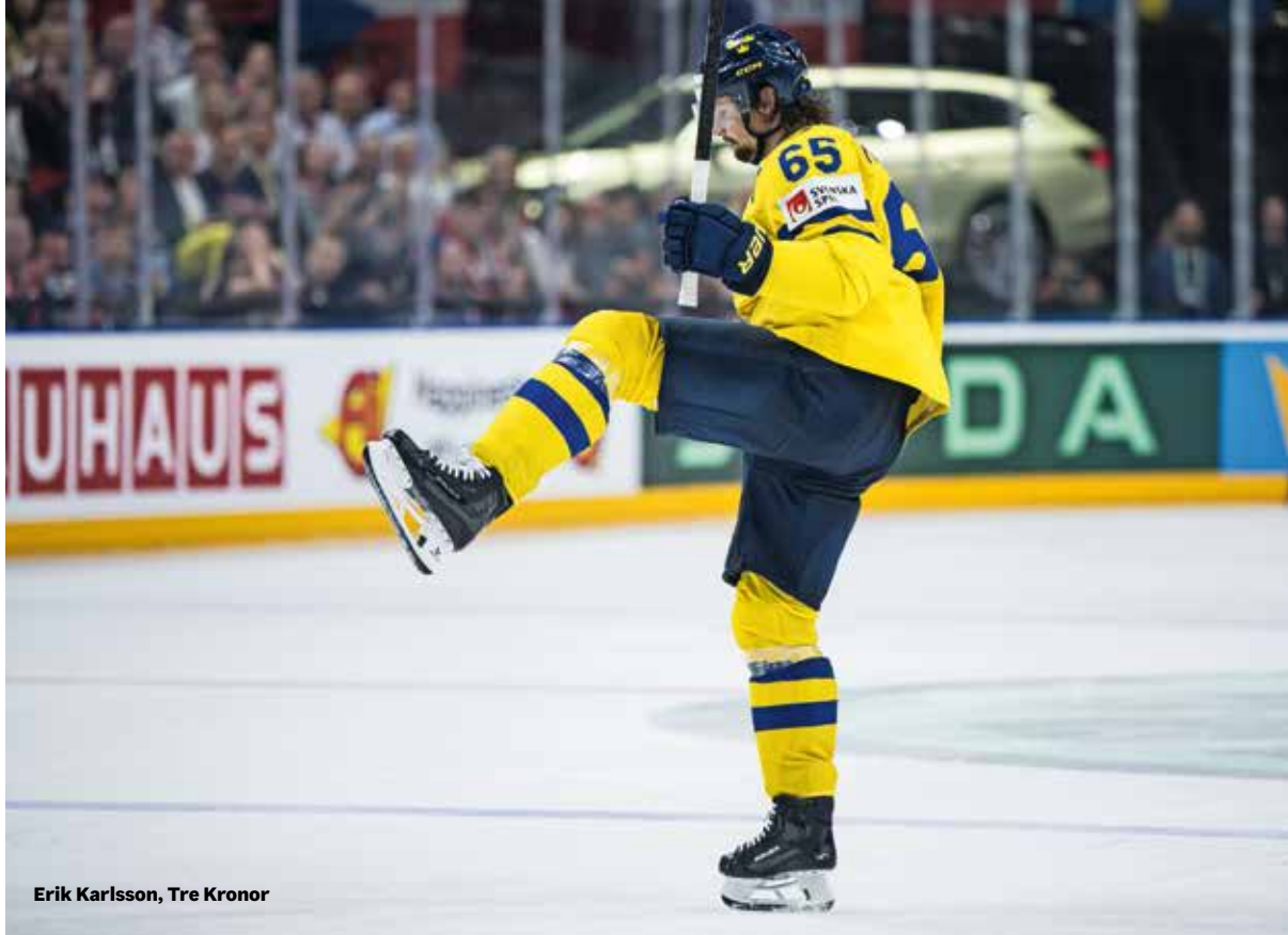
Erik Karlsson, Tre Kronor