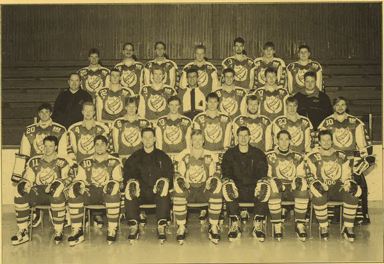
IFK Munkfors, distriktets nya div. 1-lag