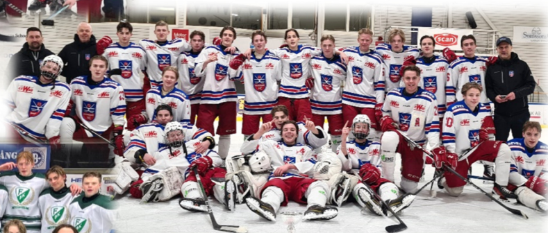
J18 DM Hammarö HC