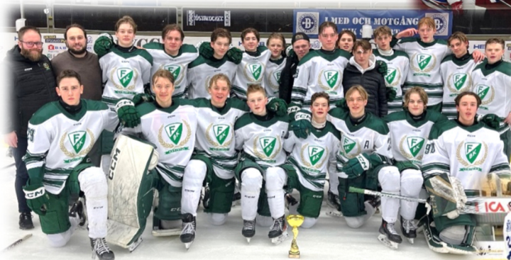
U16 DM Färjestad BK