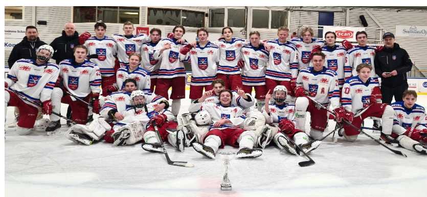
Segrare J18 DM Hammarö HC

Grums IK - Hammarö HC 0 - 2 (0-0, 0-2, 0-0)