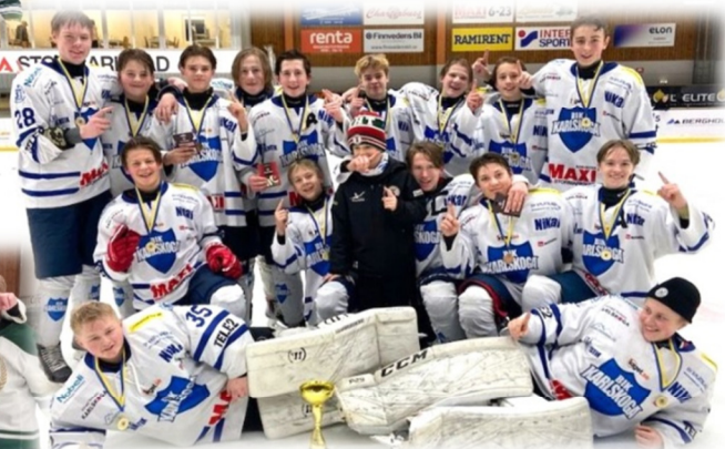
Lilla VM (U15) BIK Karlskoga/KHT