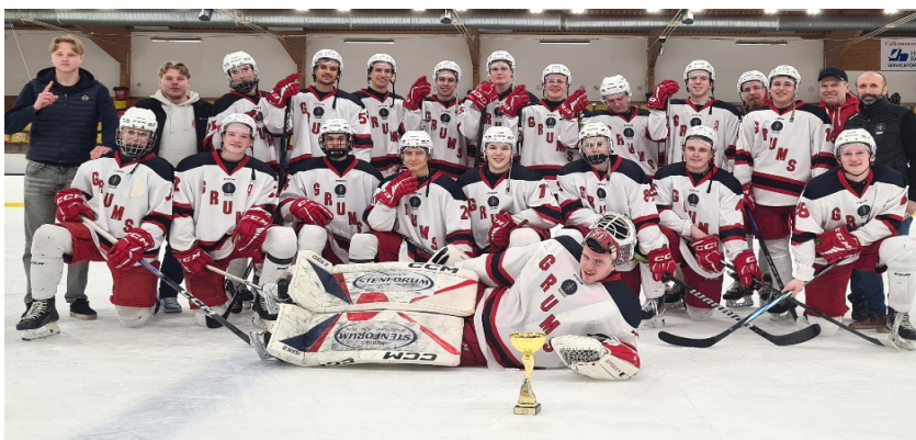
Segrare J20 DM Grums IK

Hammarö HC - Grums IK 2 - 7 (0-2, 2-1, 0-4)