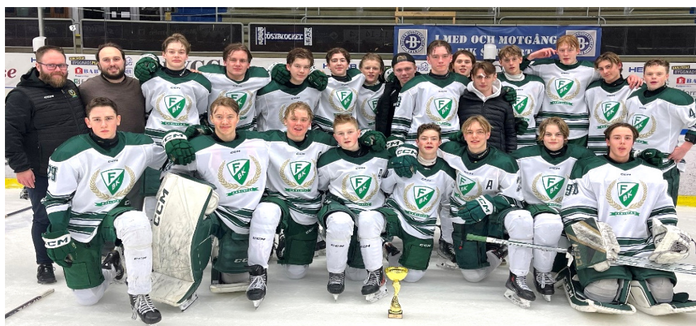
Segrare U16 DM Färjestad BK

BIK Karlskoga - Färjestad BK 1 - 10 (0-3, 1-6, 0-1)