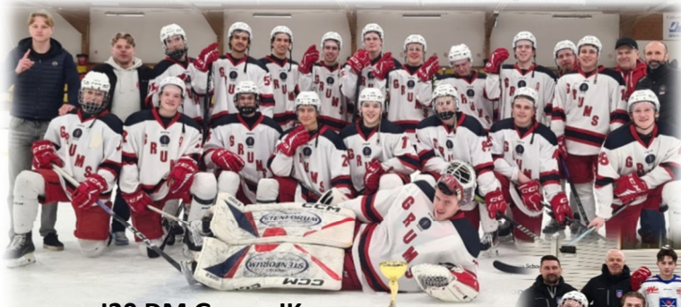
J20 DM Grums IK