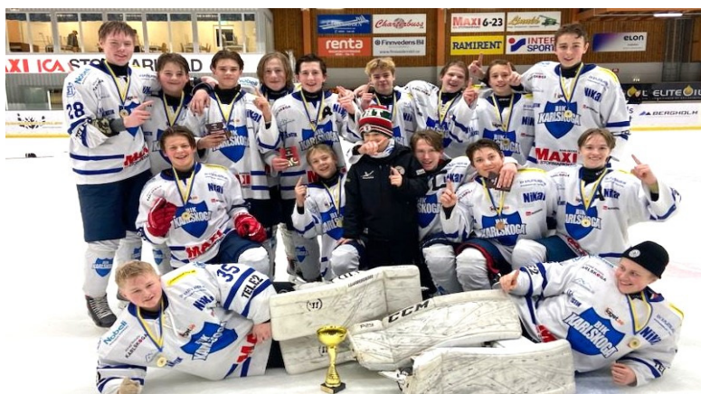
Segrare Lilla VM BIK Karlskoga/KHT