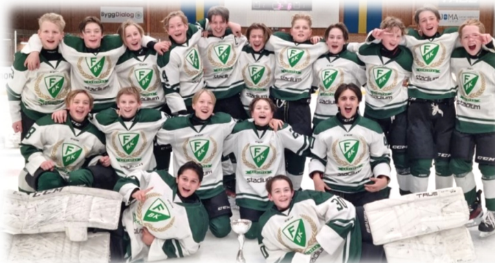
U14 DM Färjestad BK