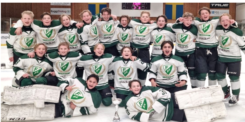
Segrare U14 DM Färjestad BK 1