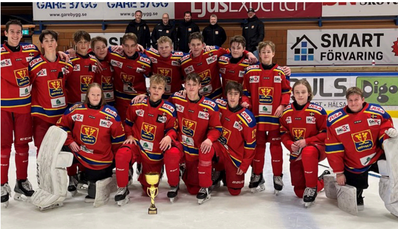
Grattis till DM vinsten, Skövde IK, U15