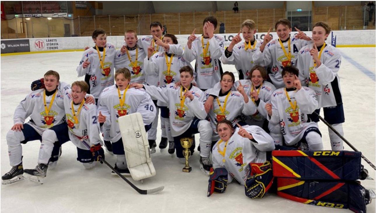
Grattis till DM vinsten, Mariestad BoIS, U16